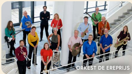
ORKEST DE EREPRIJS