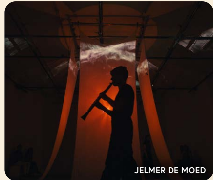
JELMER DE MOED