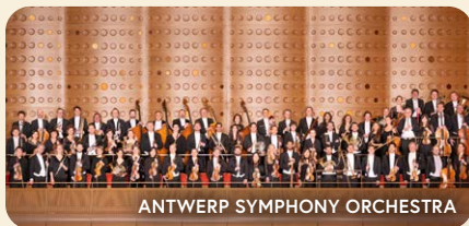
ANTWERP SYMPHONY ORCHESTRA