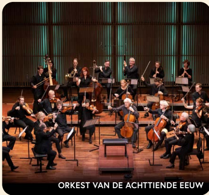
ORKEST VAN DE ACHTTIENDE EEUW