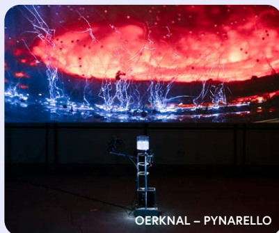
OERKNAL – PYNARELLO