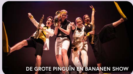
DE GROTE PINGUÏN EN BANANEN SHOW