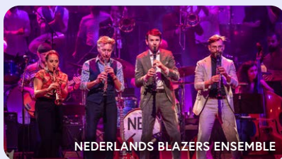
NEDERLANDS BLAZERS ENSEMBLE