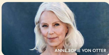
ANNE SOFIE VON OTTER

Werken van Fanny Mendelssohn | Glazunov | Maslanka